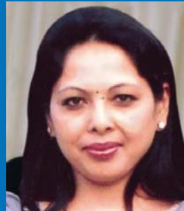
श्री अन्नपूर्ण श्रेष्ठ प्रबन्धक